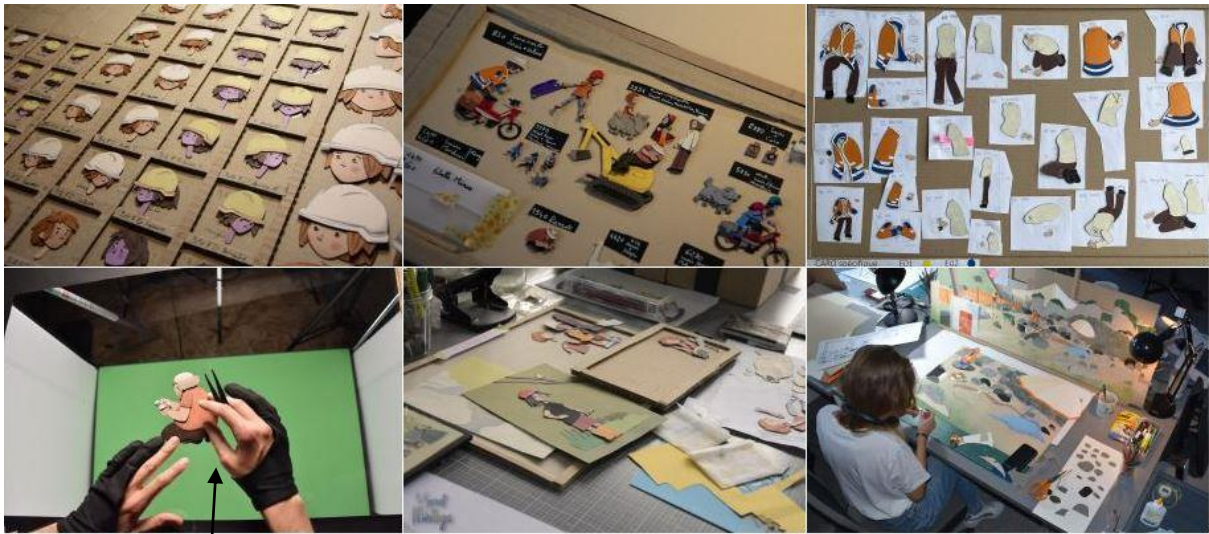
Animation d'un personnage sous la caméra.