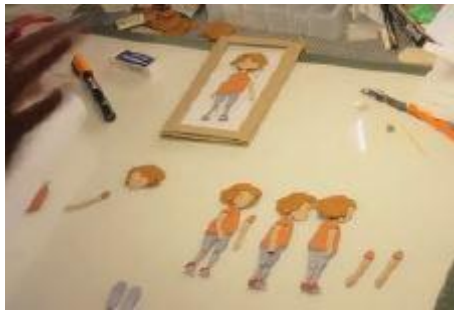
Assemblage des éléments d'un personnage