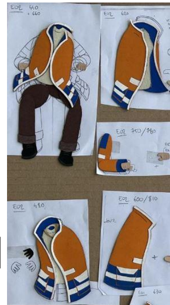
Eléments de pantins pour l'animation