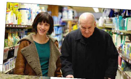
La Petite chambre