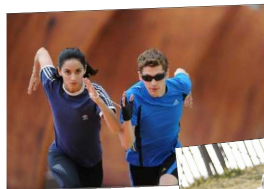
La Ligne droite